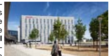
Visualisierung InterCity Hotel

Vivico Real Estate GmbH , ein Unternehmen des Immobilieninvestors CA Immo aus Österreich, investiert mehr als 50 Mio. Euro in ein neues Hotel am Berliner Hauptbahnhof. Das 8-geschossige Hotel mit 412 Doppelzimmern von je 20 qm ist als Haus der gehobenen Mittelklasse konzipiert und wird unter der Marke InterCity Hotel von der Steigenberger Hotel AG mit einem Pachtvertrag für 20 Jahre geführt werden. „Mit einem weiteren Hotel in Berlin engagiert sich Steigenberger in einem nach wie vor sehr gut wachsenden Markt“, so Arco Buijs, Sprecher des Vorstands . „Die Lage unmittelbar am Hauptbahnhof der Bundeshauptstadt stellt für uns einen 1-A-Standort dar. Mit rund 410 Zimmern entsteht hier nicht nur das größte InterCity Hotel Deutschlands, sondern auch das Flaggschiff unserer Marke.“ Die Eröffnung ist für den Herbst 2013 vorgesehen.